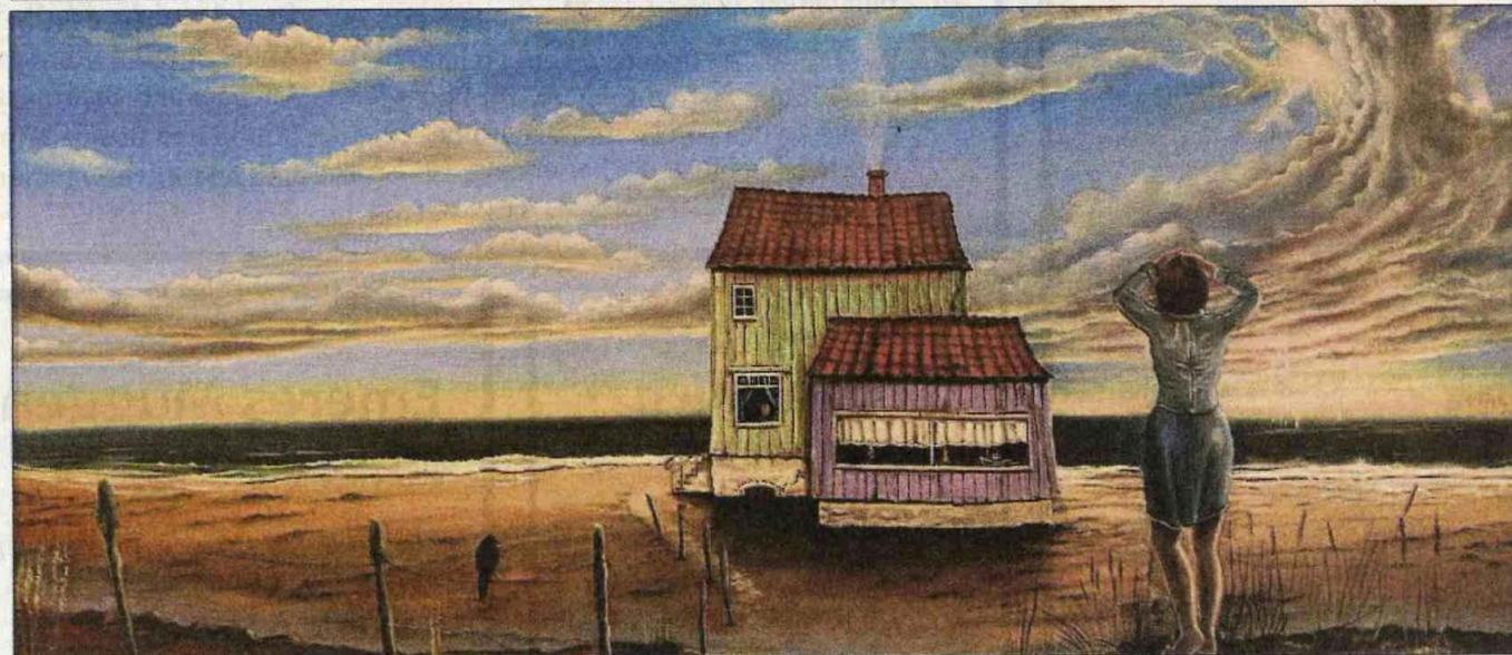
85 Kunstwerke sind im Haus Margarethenhöhe bis zum 30. Juni zu sehen.